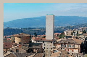
Torre degli Sciri

19.00 Concerto a cura del Liceo Classico e Musicale Mariotti